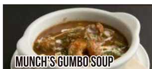
MUNCH'S GUMBO SOUP