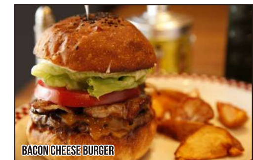
BACON CHEESE BURGER

GRILLED CHEESE SANDWICH 1,130 グリルドチーズサンド