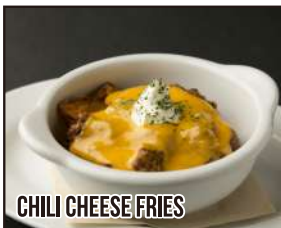
CHILI CHEESE FRIES