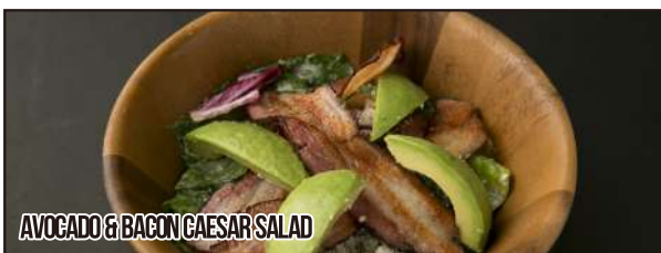
AVOCADO & BACON CAESAR SALAD